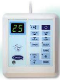
รีโมทมีสาย แบบมีตัวเลขโชว์อุณหภูมิ (อุปกรณ์มาตรฐาน)